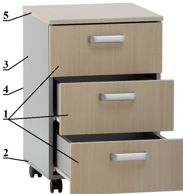
Схема сборки тумбы МД-5104.00