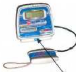
Место пломбировки ДМЭР-Х-0,5-(И)-Д2