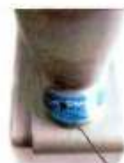
Место пломбировки ДМЭР-Х-0,5