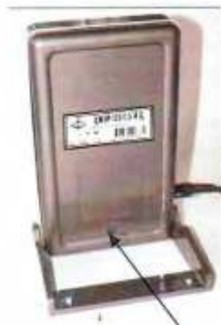
Место пломбировки ДМЭР-Х-0,5-(И)-Д1,