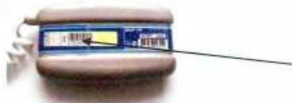
Место пломбировки ДМЭР-30-0,5-И, ДМЭР-90-0,5-И, ДМЭР-120-0,5-И