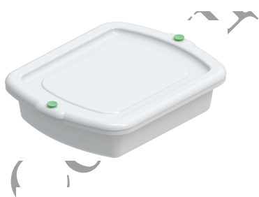
Контейнер (с лотком) для транспортировки и кратковременного хранения эндоскопов КЭ-«КРОНТ»-1(1Л) (2)