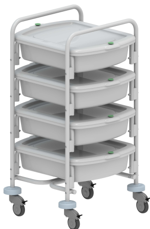
Тележка контейнерная эндоскопическая с контейнерами (с лотками) для транспортировки и кратковременного хранения эндоскопов ТКЭ-4-«КРОНТ»-1(1Л)(2)