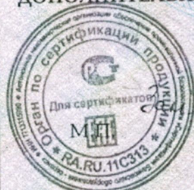
Схема сертификации 3с Инспекционный контроль – 1 раз в год