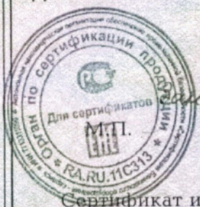
Схема сертификации 3с Инспекционный контроль – 1 раз в год