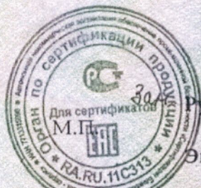
Схема сертификации 3е Инспекционный контроль – 1 раз в год