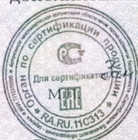
Схема сертификации 3с Инспекционный контроль – 1 раз в год