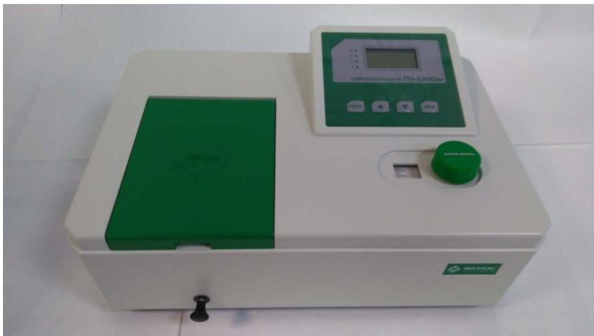
Рисунок 1 – Общий вид спектрофотометра модели ПЭ-5300ВИ