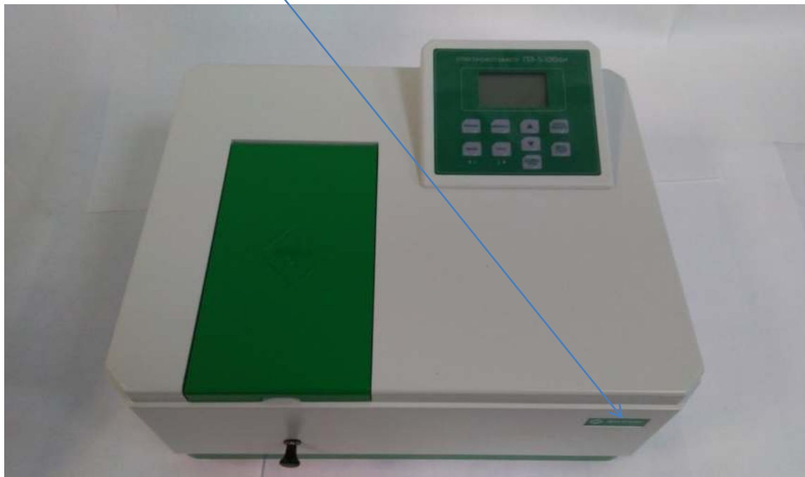
Рисунок 4. Общий вид спектрофотометра модели ПЭ-5400ВИ