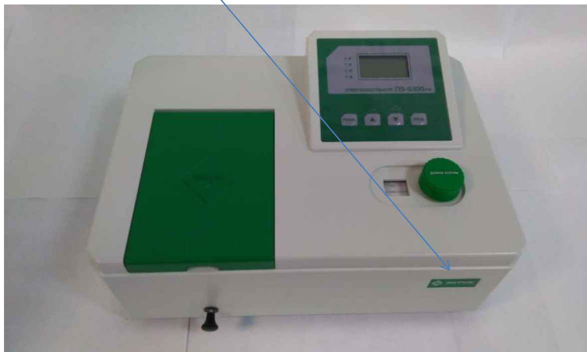
Рисунок 2 - Общий вид спектрофотометра модели ПЭ-5300УФ