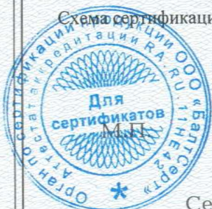
Схема сертификации: Ic